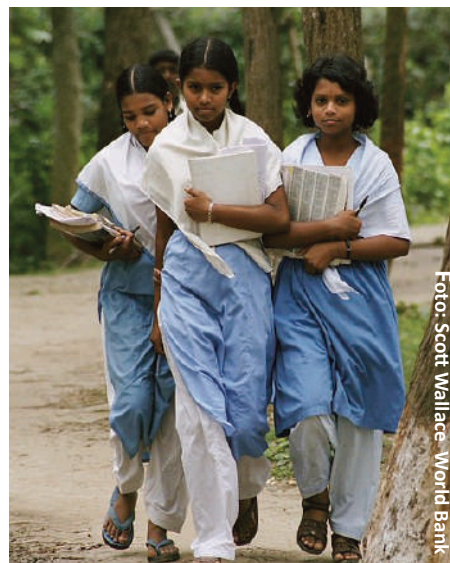
Tre jenter på vei hjem fra skolen. Bangladesh.

Bearbeidet og komprimert av Sissel Hobæk, Redaksjonen